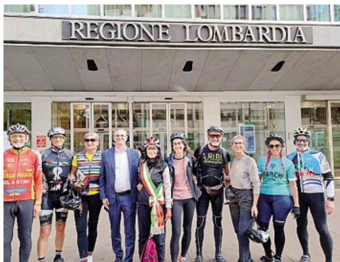
Foto di gruppo davanti al Pirellone dopo la pedalata da Pedrengo

Con ritrovo alle 8,30 alla «Ciclocioccina» del Parco Natura e Comunità, in via Giardini, il gruppetto è partito da Pedrengo alle 8,45, e ha percorso 70 km sulle piste ciclopedonali delle province di Bergamo e Milano, con tappa intermedia a Crespi d'Adda. Chiaro l'obiettivo: dimostrare che, nel complesso, si può andare in bicicletta da Bergamo a Milano, ovviamente collegando i tratti mancanti. Dopo sei ore di pedalate il gruppo è arrivato